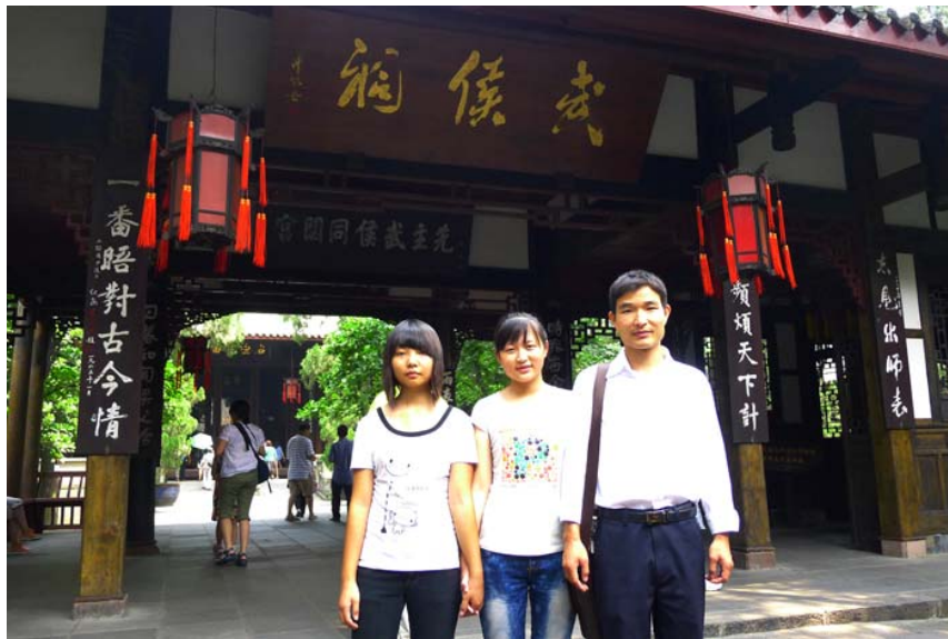
老师和两名帮扶学生参观武侯祠（汉昭烈庙）