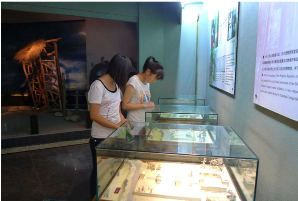
参观杜甫草堂历代模型