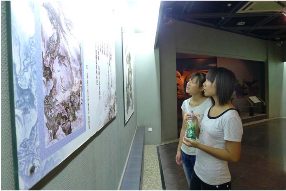
两名学生正在专心致志参观杜甫诗配画