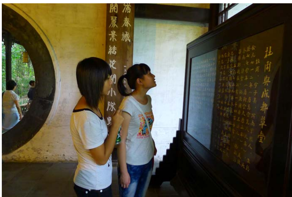
两名学生正在认真阅读“杜甫”简介