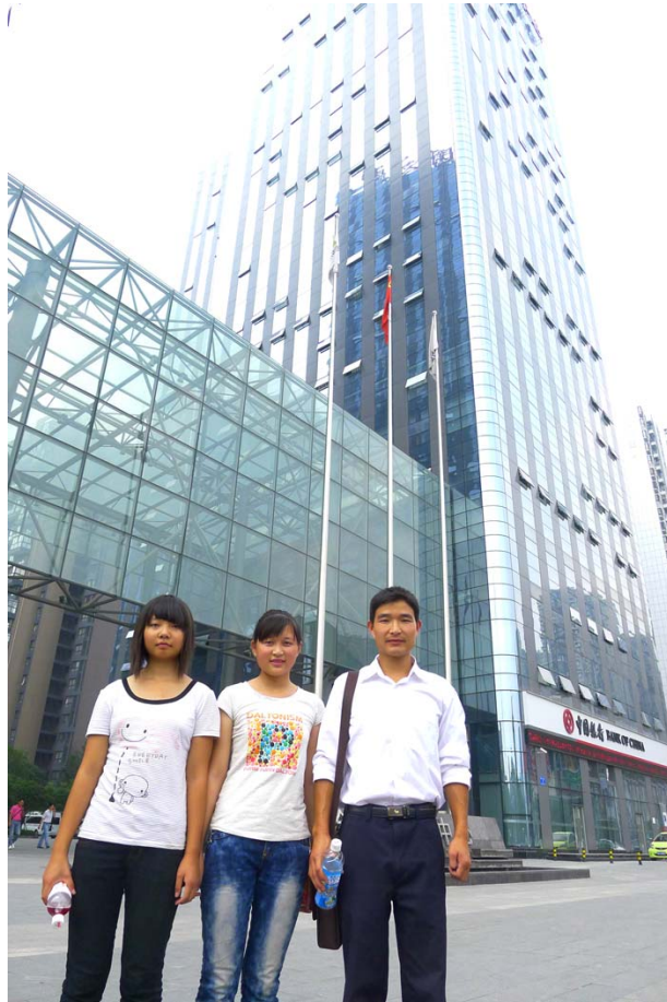
金沙万瑞中心（成办所在广场）