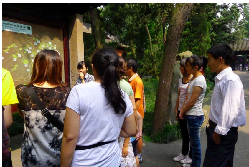
跟随其他团的导游听详细讲解

下午在学生和老师的提议之下，又参观了我们成都办事处的办公环境，2位学生表示很喜欢我们的办公环境，也想长大后在这样的好条件下上班。